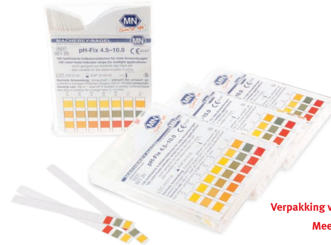
Verpakking van 100 pH test strips Meetbereik pH 4,5 – 10,0

Met pH test strips kunt u eenvoudig de zuurgraad van vloeistoffen meten. Een vloeistof is zuur als de pH lager dan 7 is en een vloeistof is basisch als de pH hoger dan 7 is. Even het pH stripje in de vloeistof dippen, kleuren van het stripje vergelijken met het kleurenkaartje, en u weet de zuurgraad!